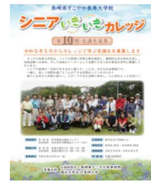
(ねんりんピック開催ポスター) (長寿大学校生徒募集パンフ)