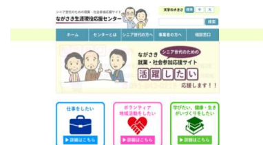
(生涯現役応援センターの画面)