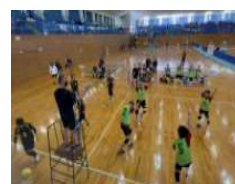
(ソフトバレーボール)