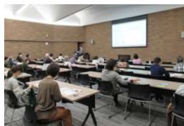
(セミナー開催風景)