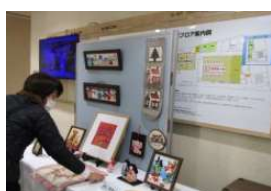
(講座: 文化祭② 作品)