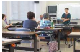
(講座: 受講生活動発表)