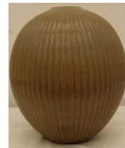
(知事賞: 工芸・彫刻)