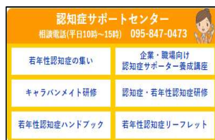
(認知症サポートセンターの画面)