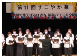
(講座: 文化祭① 合唱)