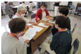
(講座: コミュニケーション)