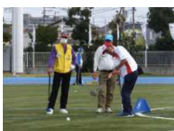
(グラウンド・ゴルフ)