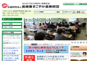
(財団HPのホーム画面)