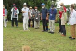
(講座: スポーツ大会)