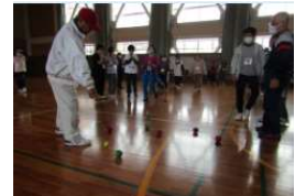
(講座: スポーツ大会)